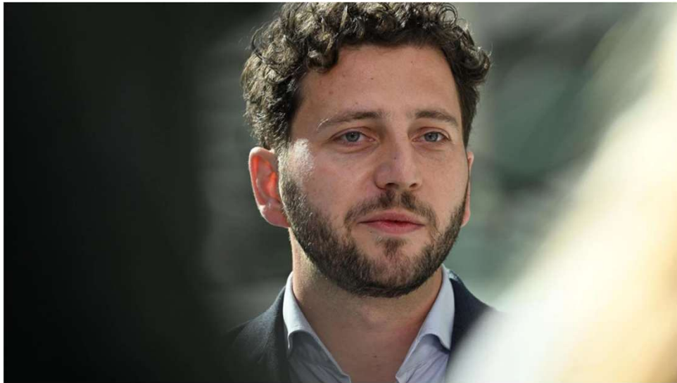
Derzeit laufen Ermittlungen gegen Grünen-Chef Felix Banaszak.

Neue Mobbingvorwürfe an Max-Planck-Institut